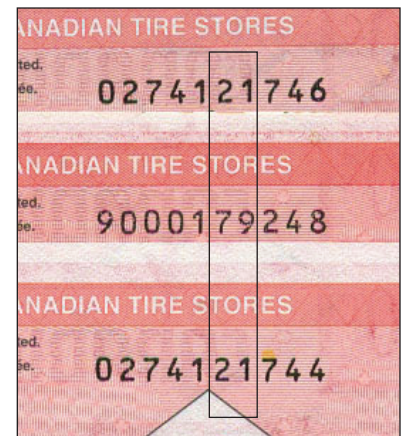
En haut - CTC S27-C05 Centre - CTC S27-Ca02 En bas - CTC S27-C05