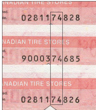
En haut - CTC S27-C05 Centre - CTC S27-Ca04 En bas - CTC S27-C05