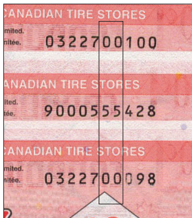
En haut - CTC S29-C07 Centre - CTC S28-Ca06 En bas - CTC S29-C07