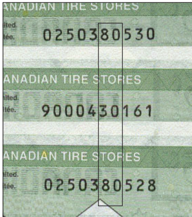
En haut - CTC S27-B05 Centre - CTC S27-Ba05 En bas - CTC S27-B05