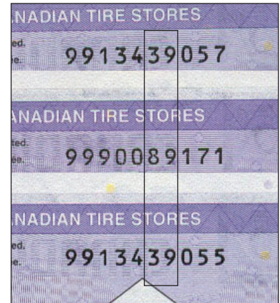
En haut - CTC S27-D06 Centre - CTC S27-Da04 En bas - CTC S27-D06