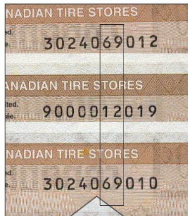
En haut - CTC S27-E06 Centre - CTC S27-Ea03 En bas - CTC S27-E06