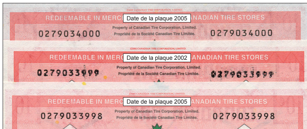
Le billet 0279033999 (un remplacement même numéro) est numéroté à la main.